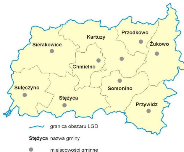
Rys 1. Mapa obszaru objętego LSR.

Poniżej wskazano mapę obszaru objętego LSR z zaznaczeniem granic poszczególnych gmin, która wskazuje jednoznacznie na spójność przestrzenną obszaru objętego LSR.