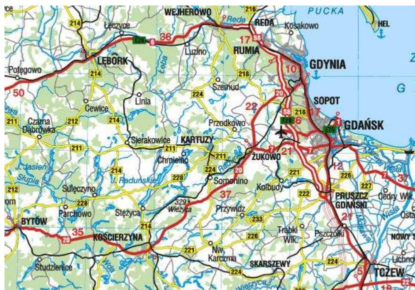
Rys. Położenie obszaru LGD w regionie (obszar LGD wraz z obszarami sąsiednimi).

Pod względem fizycznogeograficznym obszar Lokalnej Grupy Działania położony jest w całości na terenie Pojezierza Kaszubskiego należącego do makroregionu Pojezierza Wschodniopomorskiego i podprovincji geograficznej Pobrzeży Południowobałtyckich. Pojezierze Kaszubskie jest tym samym największym regionem fizycznogeograficznym województwa pomorskiego. Obszar ten sąsiaduje z: