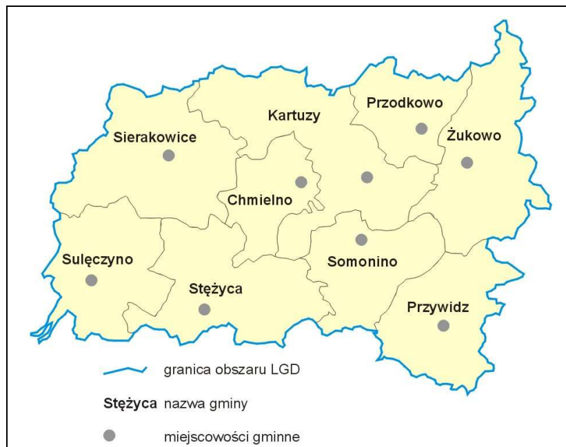
Rys. Obszar LGD.

Jak wynika z przedstawionego opisu oraz załączonej poniżej mapy teren LGD jest w pełni spójnym obszarem pod względem przestrzennym.