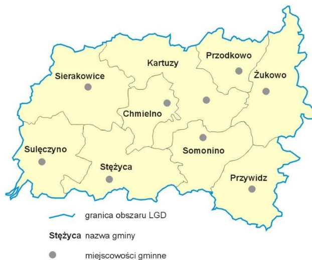
Rys 1. Mapa obszaru objętego LSR.

Poniżej wskazano mapę obszaru objętego LSR z zaznaczeniem granic poszczególnych gmin, która wskazuje jednoznacznie na spójność przestrzenną obszaru objętego LSR.